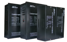
Fuente de poder